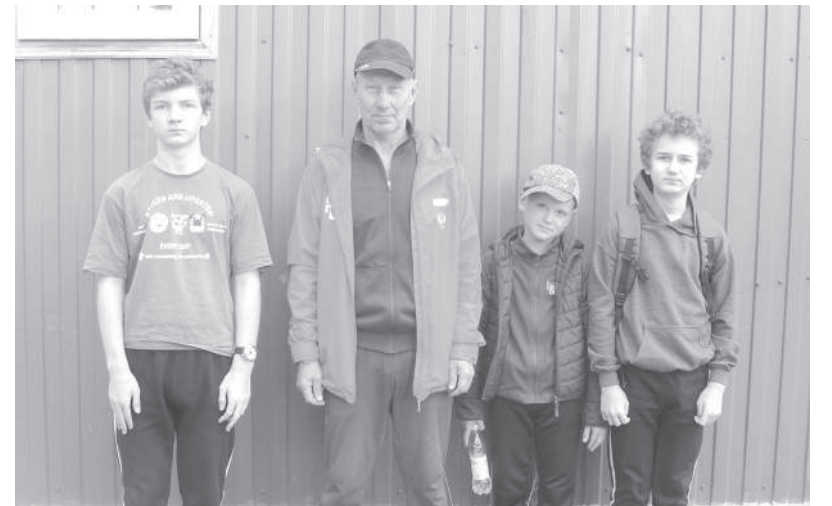
Тренер и ученики. Это уже история