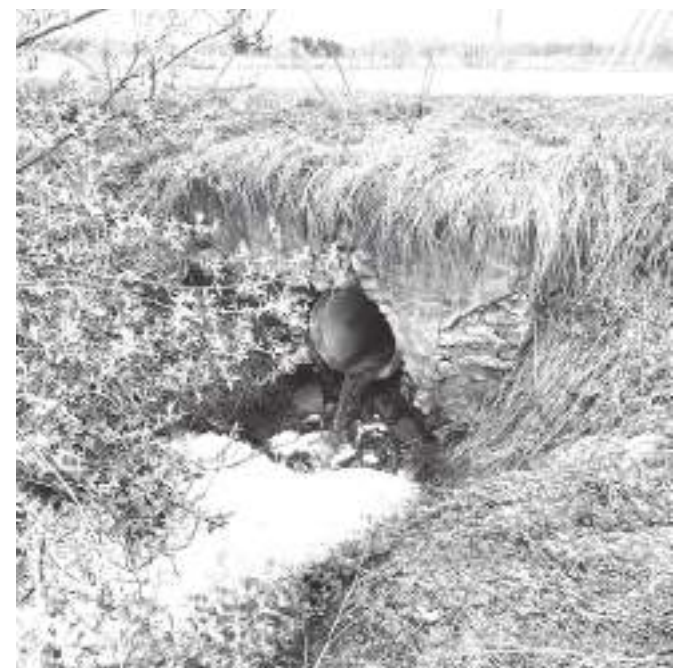
Стекающая из трубы в пруд вода могла принести отраву