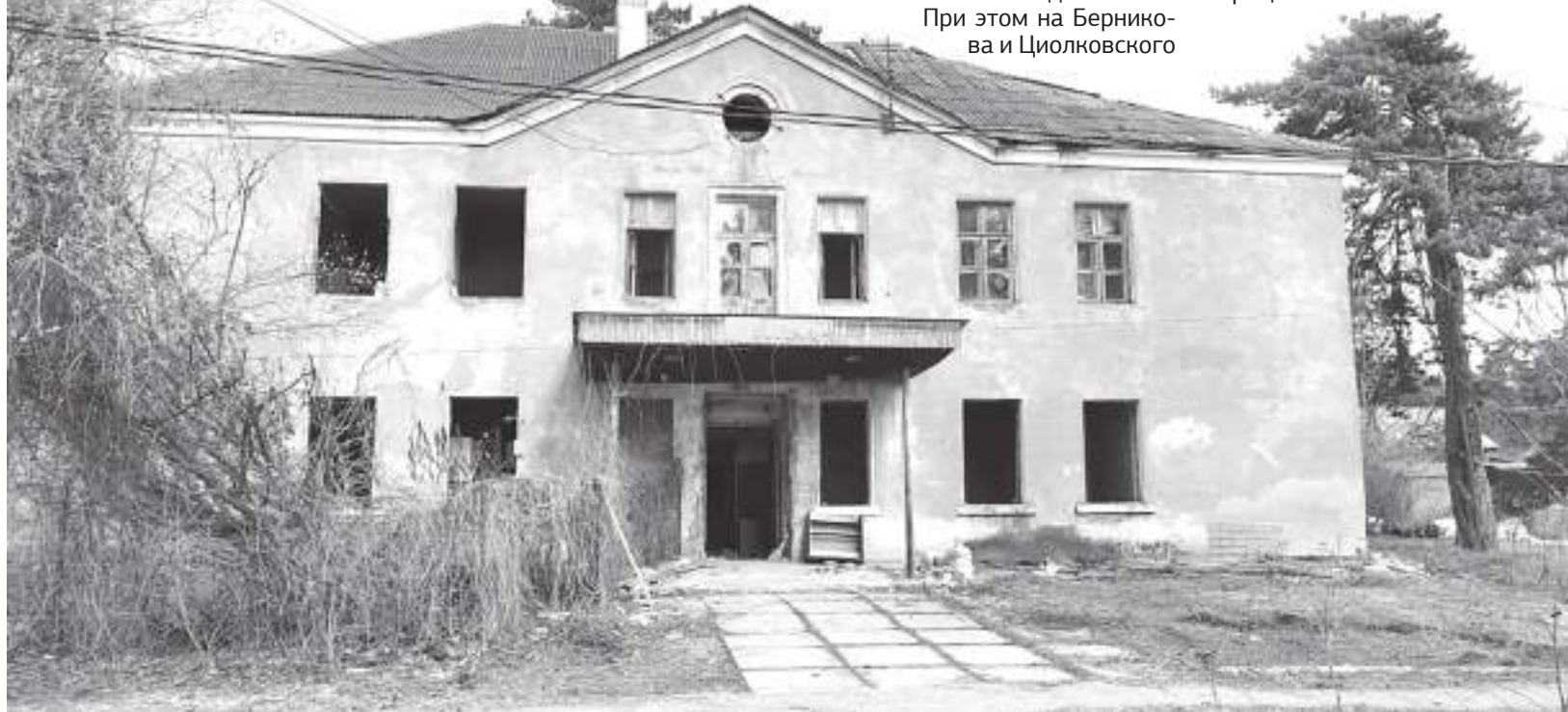
Первыми на аукцион поступят документы на здание по адресу: улица Берникова, 122. На его месте появится большой по площади и этажности дом

Также она поделилась новостью о создании в Боровске образовательного технического колледжа. Он должен появиться в микрорайоне Роща и будет готовить специалистов в сфере современных технологий: IT и робототехники. Под его строительство город выделил чуть более гектара земли.