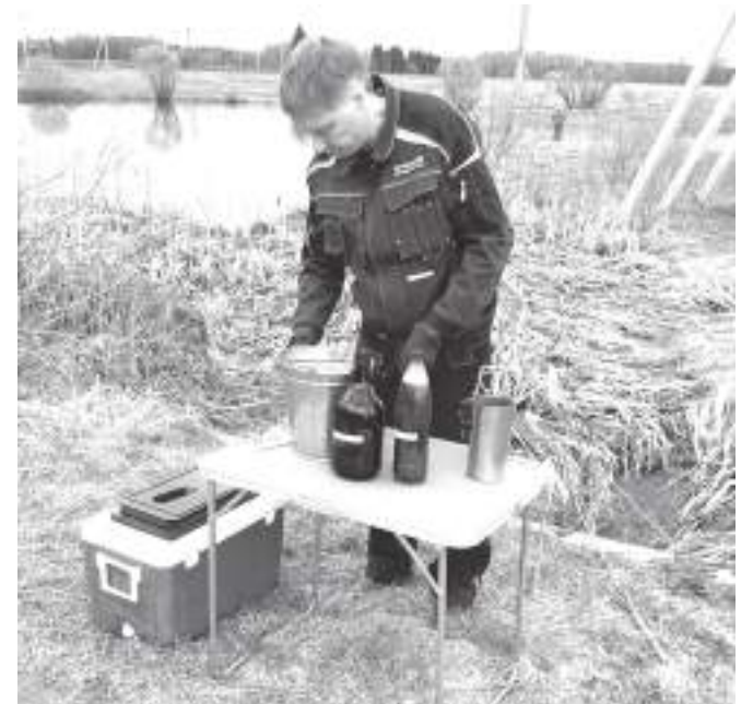
В Асеньевском зафиксирована массовая гибель рыбы

Другая беда произошла на пруду в Асеньевском. В минувшие выходные в социальных сетях появилось видео с сотнями плавающих брюхом вверх рыб. Жи-