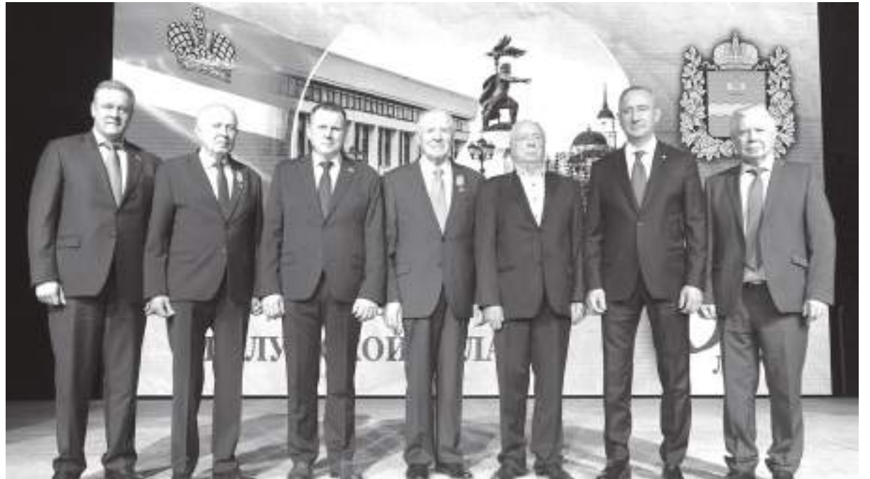
Председатели Законодательного Собрания Калужской области различных созывов и губернатор региона

11 апреля в Калуге состоялась торжественная конференция, посвященная 30-летию Законодательного Собрания.