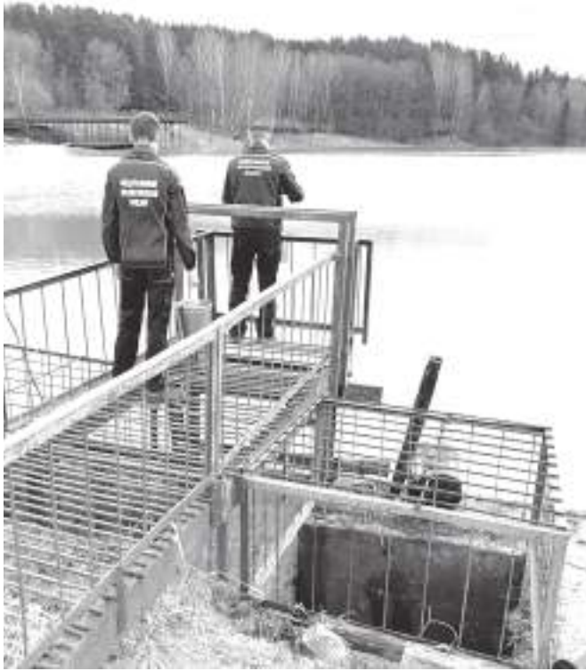
Что таят в себе воды, станет ясно уже на этой неделе