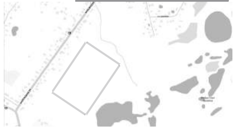
На участке, где возведут новое здание для боровской второй школы, также появится многоквартирный жилой район

Многие знают, что на районном уровне муниципалитет движется к возведению нового здания для второй школы. Будущее строение рассчитано на тысячу учеников. На участке около семи с половиной гектаров, кроме объектов образовательной сферы, выделены четыре гектара под многоквартирные дома.