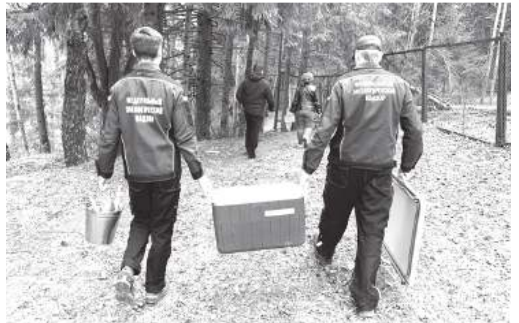
Пробы воды специалисты взяли и в ручье выше по течению