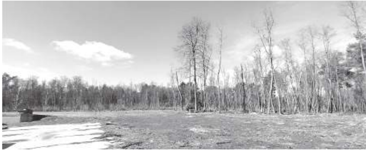
На улице Некрасова к 2030 году построят два жилых комплекса на 400 квартир каждый

Так, например, 31 декабря прошлого года в городе закончился один из этапов программы переселения граждан из аварийного и ветхого жилья. За-