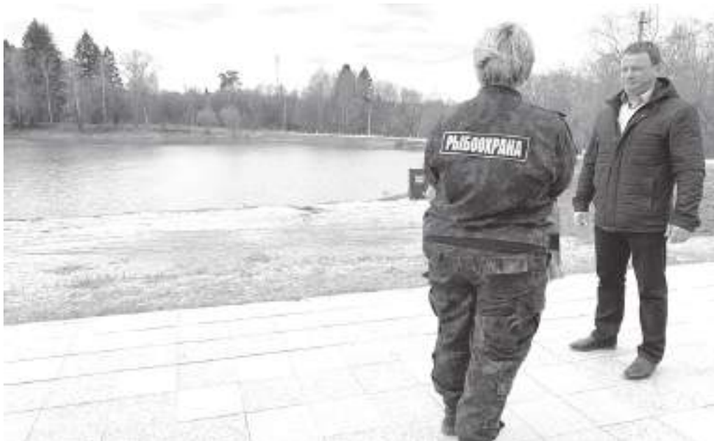
Сотрудники Рыбоохраны уверены, что рыба в Страдаловке погибла давно

В понедельник для оценки ущерба на месте побывали представители регионального Минприроды и Рыбнадзора вместе с лабораторией. По самым скромным подсчётам, погибли не менее 25 тысяч обитателей водоёма. Так что, скорее всего, результатом проверки станет возбуждение уголовного дела природоохранной прокуратурой по факту нанесения ущерба.