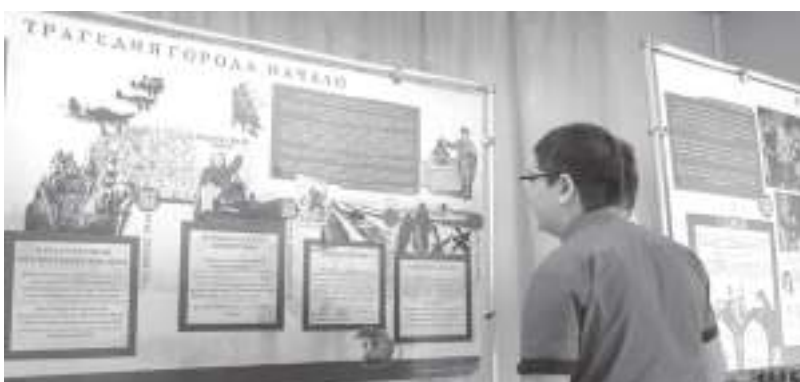
На стендах экспозиции отражены основные вехи событий 80-летней давности. Используя смартфоны, школьники могут подробнее узнать о книге и жителях города во время Великой – венной войны