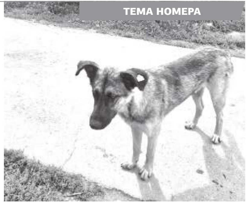
Эти собаки с бирками уже год пробуют на зуб местных жителей, но служба отлова отказывается их забирать

Казалось бы, очевидная брешь в законе, которую почему-то не торопятся устранять. И это учитывая, что новая система отлова действует уже четыре года. Кроме того, год назад правительство РФ отдало регионам право определять случаи, при котором возникает угроза жизни и здоровью человека от бродячих животных. То есть Калужская область сама вправе закрепить правила действия в таких ситуациях. И некоторые субъекты уже воспользовались этим. Например, в Тюменской области агрессивную собаку забирают с улицы, наблюдают за её поведением десять дней, общаются с людьми, ко-