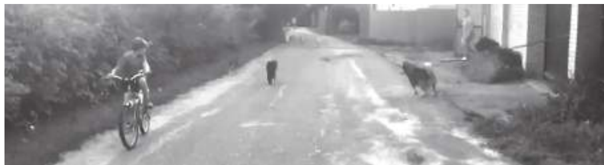
На переулке Садовом, расположенном аккуратно между школой и детским садом, на людей бросается целая свора собак

Если районные депутаты работают быстро, то совсем скоро вопрос рассмотрят на региональном уровне. Поддержат ли вышестоящие коллеги такое предложение, покажет время. Пожизненное содержание одной собачки – удовольствие дорожное – порядка 50 тысяч рублей из бюджета. Но, думается, жизнь и здоровье людей всё таки дороже денег, а закон должен быть зубастее собак?