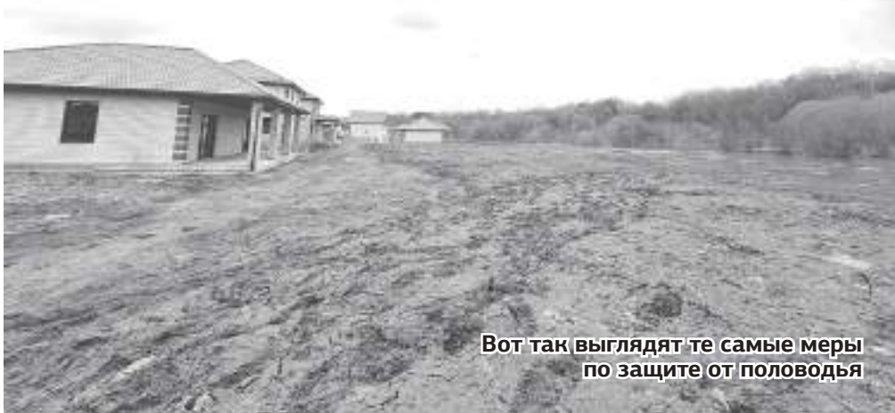
Вот так выглядят те самые меры по защите от паводья

Борьба воды и земли на берегу Протвы на Текстильной завершилась победой последней – паводок к коттеджам не подобрался. Теперь ермолинцы гадают, останется ли после этой войны у них пляжная зона или гулять вдоль реки больше не получится