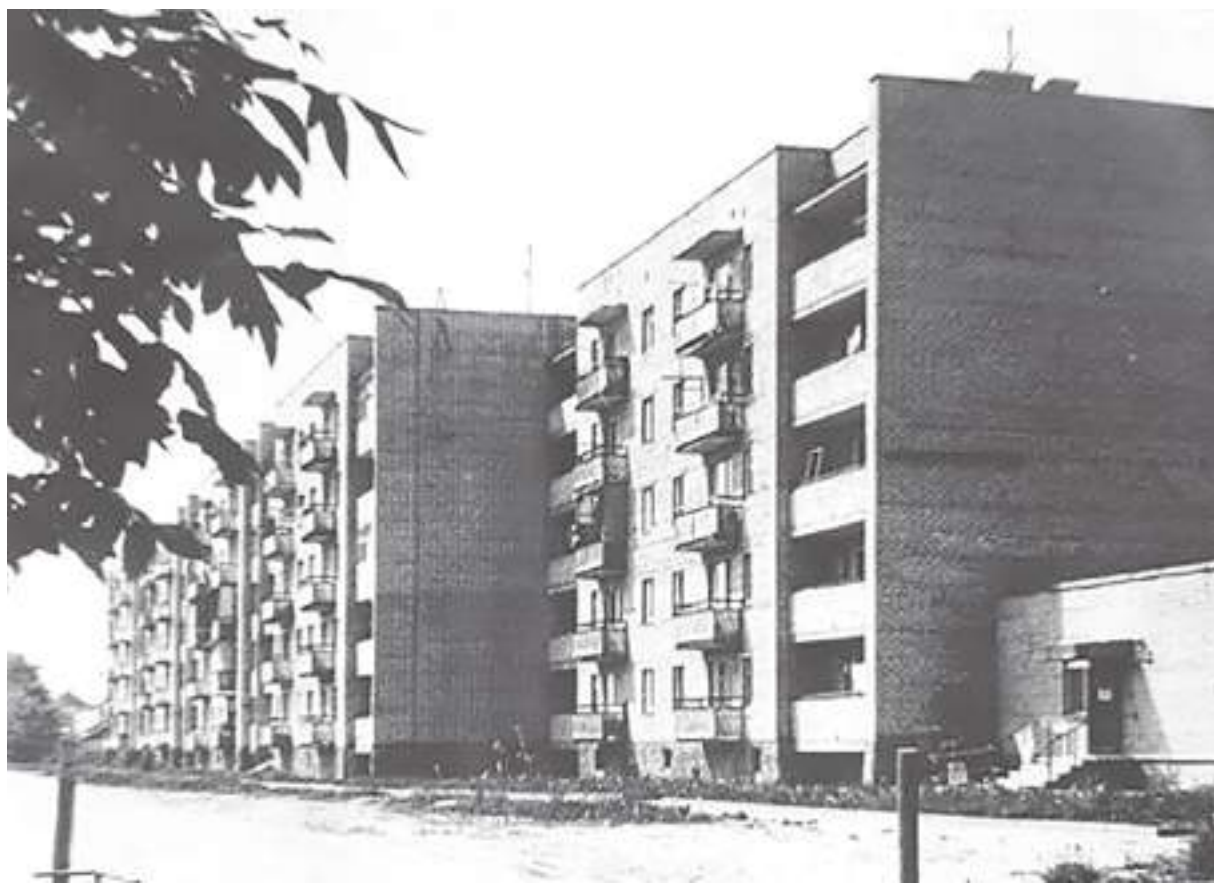
До развала Советского Союза незрячие бесплатно получали в Русиново жильё