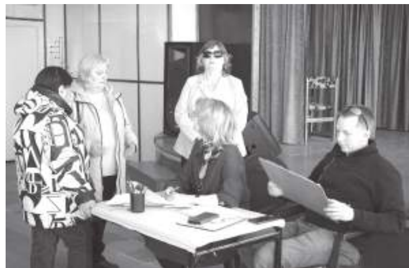
Русиновцы поделились воспоминаниями о том, как раньше жилось в микрорайоне, и помечтали о доступной и современной среде