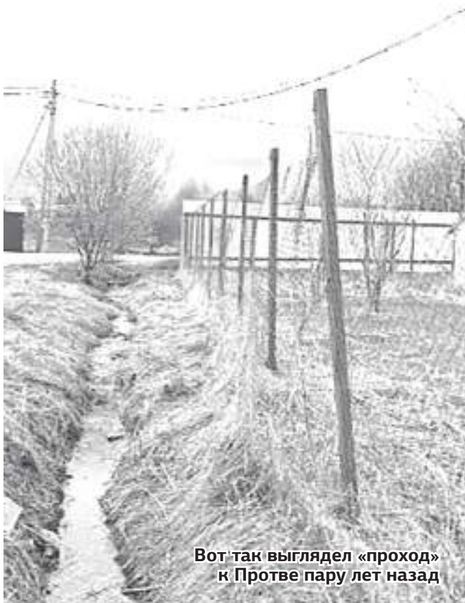
Вот так выглядел «проход» к Протве пару лет назад

Будет ли теперь кто-то заниматься обустройством тротуара, большой вопрос – детский пляж юридически никак не оформлен, а без бумажки у нас, как известно, всё – коричневая и дурно пахнущая субстанция. Но в данном случае важнее, чтобы было к чему проходить по этой дорожке. Население опасается, что эту насыпь просто смывает в реку паводком, что не только сотрёт береговую полосу, но и сузит русло самой реки. Так или иначе, останется ли что-то от детского пляжа, увидим по окончании паводка.