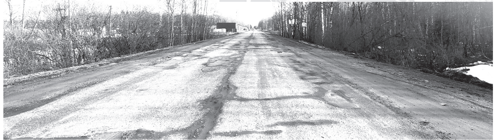
Сегодня улица Наро-Фоминская – это одна сплошная неровность

Вместо митяевской дороги в ремонт отправили комлевскую