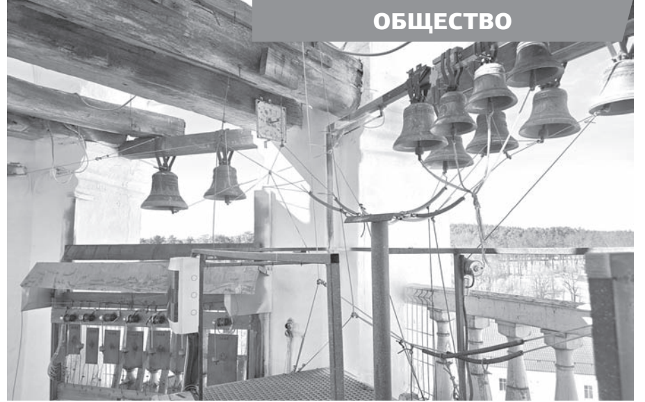
Колокольня устроена достаточно сложно. Неудивительно, что будущие звонари тратят приличное время на обучение такому тонкому ремеслу