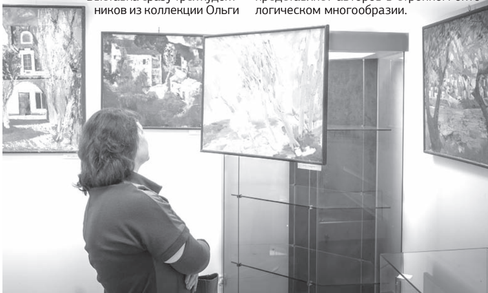
Экспозиция знакомит боровского зрителя сразу с тремя художниками

Также боровчанин высоко оценил работу по развеске и подборке картин в пространстве центра. Экспозиция будет выставлена до 10 апреля. Срок небольшой, поэтому настоятельно рекомендуем не пропустить это знаковое событие в культурной жизни.