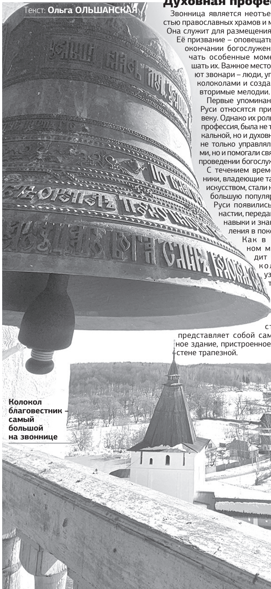
Колокол благовестник – самый большой на звоннице

К слову, под куполом также установлены часы с курантами, отбивающие время с промежутком в 15 минут. Электронный механизм отмечает каждую четверть мелодичным звоном. Бьют они определённым образом, можно сразу понять сколько сейчас времени. В первую четверть часа звон слышен один раз, во вторую – два раза и дальше по нарастающей. Каждый полный отмечается ударами колокола. Механизм часов устроен интересным образом. Он имеет семь пластин, по которым каждые 15 минут «звонит» точное время.