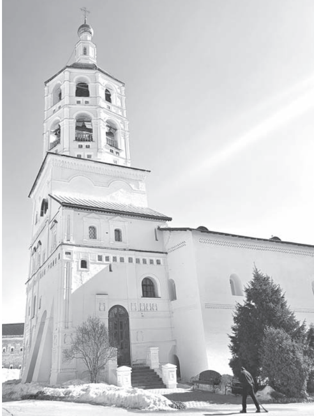
Верхние два яруса конструкции предназначены для звона, причём колокола размещаются в нижнем восьмигранном ярусе